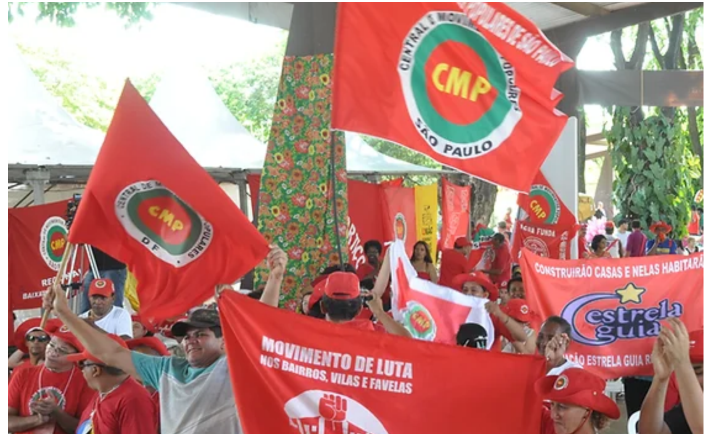
Na luta. CMP completa 30 anos de luta e resistência!

No último período a CMP, junto ao MLB e a Unidade Popular (UP), foi linha de frente no combate ao fascismo, ajudando a convocar mobiliza-