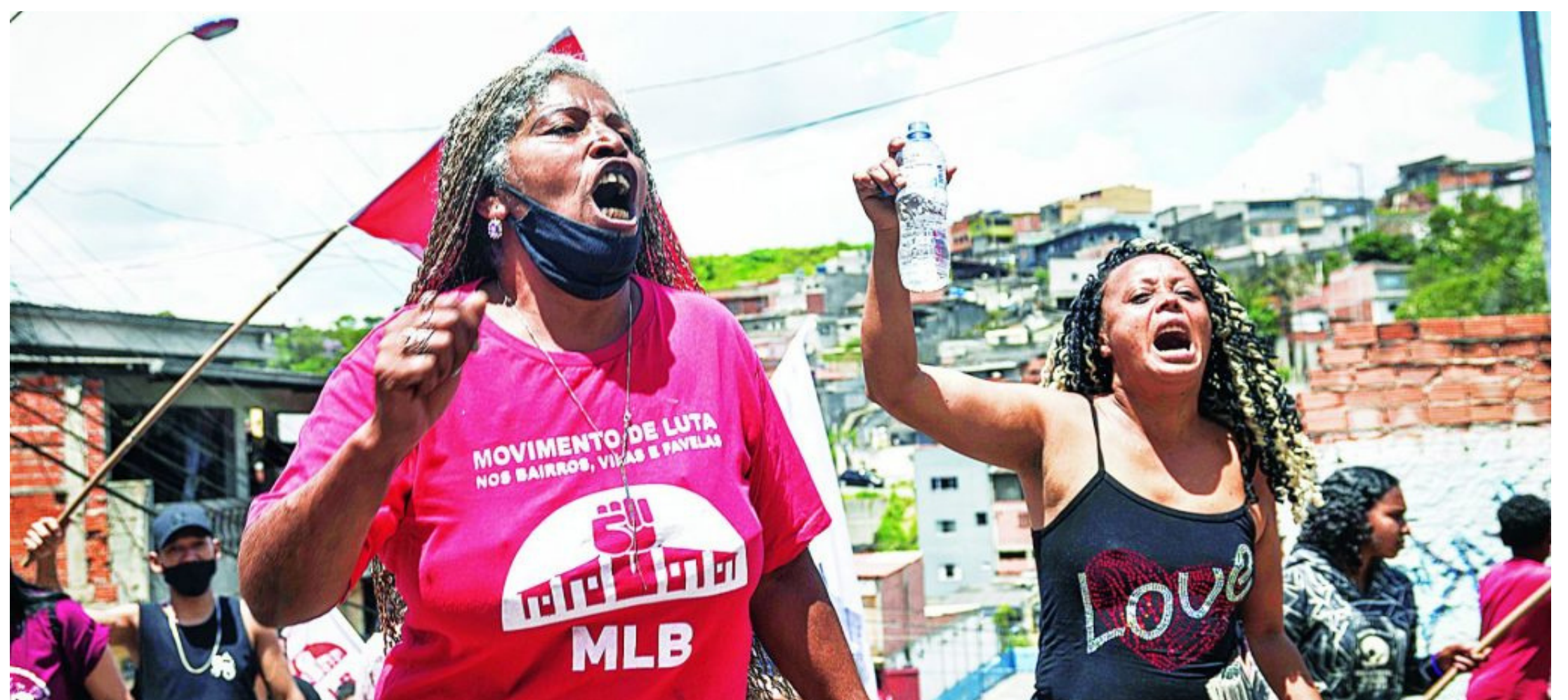
Luta por moradia. Protesto organizado pelas famílias do MLB em SP

Por isso, o MLB segue em luta, organizando novas batalhas pela reforma urbana e pelo socialismo.