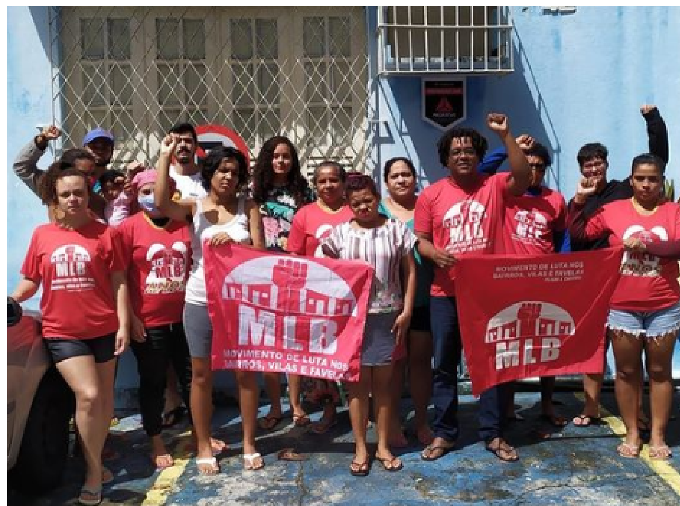
Formação Curso da Escola Nacional Eliana Silva

Através de frentes de trabalho, os núcleos também cumprem o papel de organizar o trabalho do Movimento. Oferecem suporte técnico às ocupações e bairros onde o MLB atua, fazem lutas dentro das universidades, com articulações de projetos de pesquisa e extensão. São responsáveis pela agitação e propaganda, dando suporte nas redes sociais, elaborando campanhas e outras atividades. Venha se organizar com a gente e construir os núcleos de luta do MLB no seu estado! Participe dessa luta ao lado do MLB, entre em contato conosco.